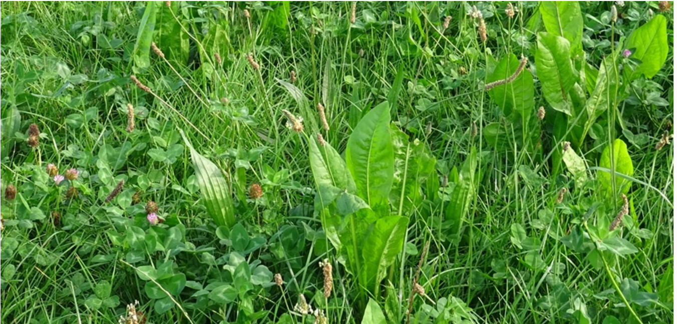
Foto 2: Een evenwichtige samenstelling van grassen, kruiden en vlinderbloemigen lijkt een stabiliserende invloed op de voederwaarde te hebben doorheen het jaar